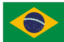
⑤リオデジャネイロ